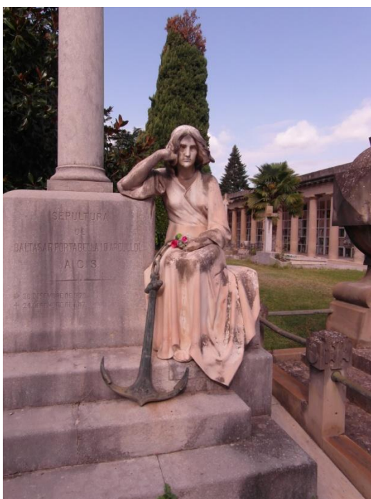
Panteó de Baltasar Portabella i d'Argullol amb l'escultura de Josep Llimona.

El cementiri de Manresa conté un immens patrimoni, sobretot arquitectònic i escultòric, que roman obert i amagat alhora entre panteons, capelles i escultures. Una iconografia funerària d'artistes tan importants com Josep Llimona i Bruguera , Carles Flotats i Galtés , Alexandre Soler i March , Pau Bergonyós , Josep Firmat i Serramallera , Bernat Pejoan o Eusebi Arnau i Mascort , entre molts d'altres, tots ells figures destacades de l'art de finals del segle XIX i principis del XX. ( Informació biogràfica o ampliada molt interessant, en molts casos sorprenent, als enllaços de color blau )