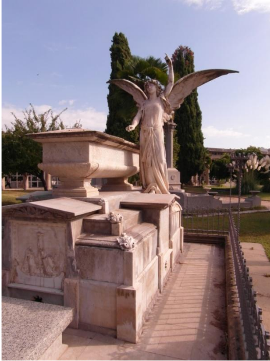
Panteó guardat per un àngel, un dels motius més significatius del cristianisme.

Com veieu el cementiri de Manresa, deixant de banda la seva funció principal, la d'enterrar morts, constitueix un conjunt monumental francament interessant per ésser visitat amb curiositat. Això si, sense menyscabar el respecte envers el recinte, construït de bon començament sagrat.