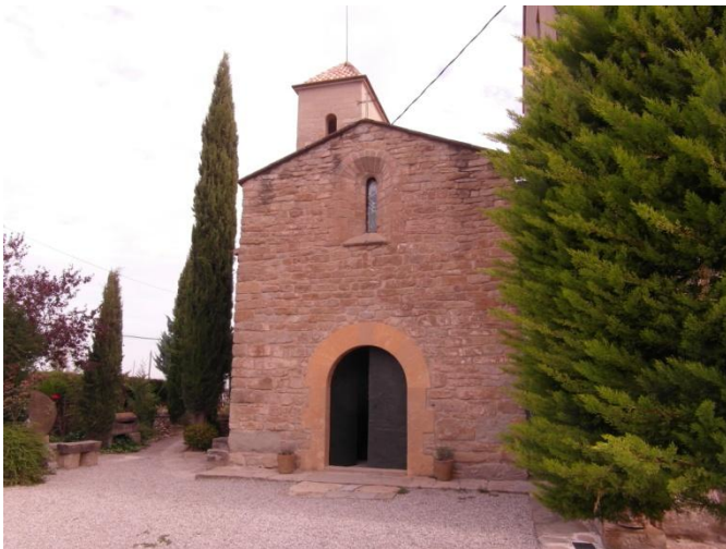
Actual façana des d'on s'accedia antigament al cementiri adossat

Per a fer-ho haver d'embarcar-se al moll de Barcelona. La ciutat, però, es trobava tancada i assolada per la pesta i Ignasi s'allotjà a Montserrat, on deixà els seus vestits i l'espasa als peus de la Mare de Déu la nit del 24 al 25 de març de 1522. Vestit amb parracs i descalç vingué a Manresa aquell mateix dia on va romandre fins a principis de febrer de l'any següent, vivint a la que avui coneixem com la Santa Cova i duent una vida de pobresa, oració, i penitència. Vet aquí els lligams de Sant Ignasi de Loiola amb Viladordis i la ciutat de Manresa. (1)