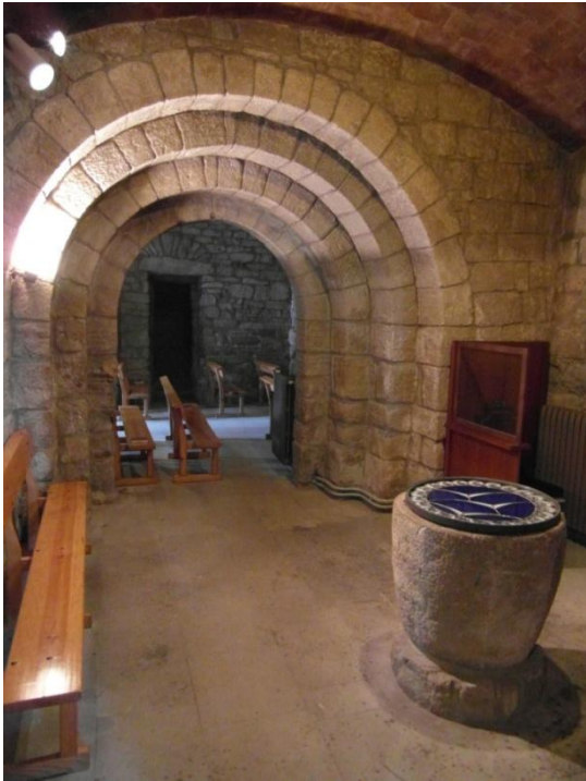
Portalada romànica amb la pila baptismal

Quan parlem de tants segles enrere les dates poden variar segons les fonts de les que beguem, de vegades de manera ostensible. Tal és el cas, a tall d'exemple, del sarcòfag que hem esmentat que alguns situen al voltant del segle X i altres consideren que es tracta d'una peça dels segles XII-XIII. S'addueix en aquest cas, com a causa del desconeixement, l'absència de cap mena d'ornamentació, cosa que en dificulta la datació.