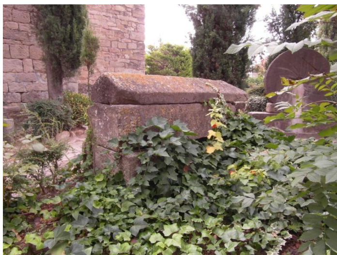
Sarcòfag medieval de tipus antropomorf datat als segles IX o X

L'accés a l'edifici es fa ara per una porta oberta modernament. L'original, autènticament romànica, avui no manté la primitiva funció ja que només ens introdueix a la capella del Sant Crist, actualment adossada al mur meridional i on s'hi troba també una pila baptismal de pedra, probablement del segle XI o XII.