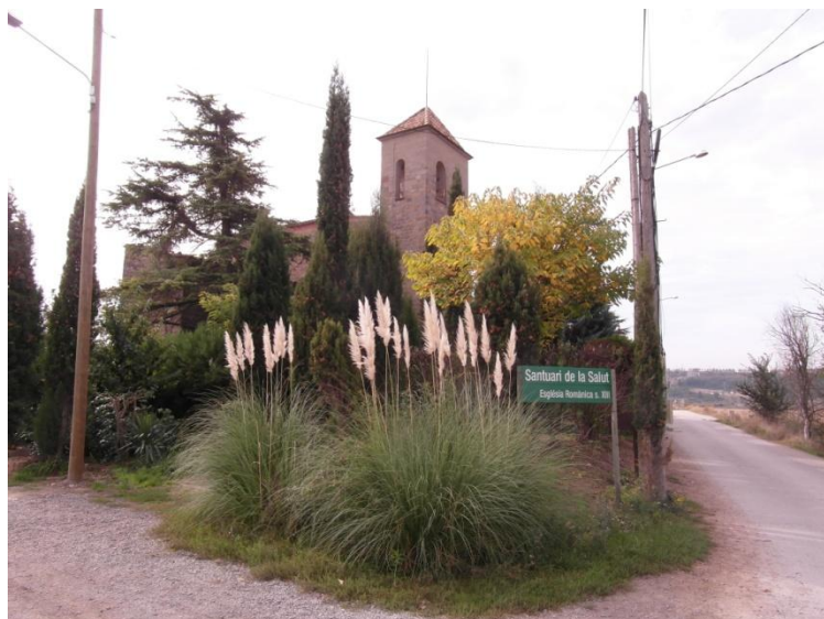
Santuari de Santa Maria de Viladordis, també conegut com de la Salut

Viladordis, història, llegenda, art i salut