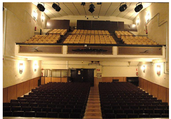
Platea i amfiteatre de la Sala els Carlins en l'actualitat

Durant aquestes darreres dècades l'activitat més destacada del Casal ha estat en l'àmbit del grup de teatre, els Pastorets, l'organització de concursos i mostres de teatre i la participació en diverses iniciatives ciutadanes.